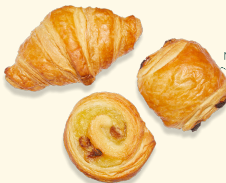
Mix Mini Viennoiserie 30g