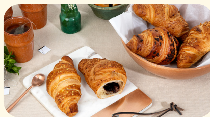
Zoete Gevulde Croissants